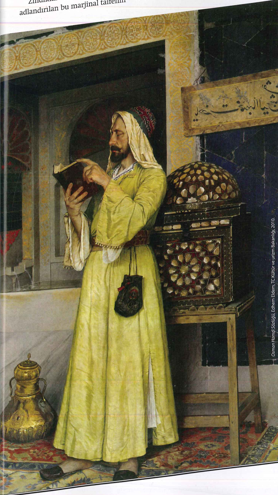
Osmanlı Hâmedî Sözlüğü, Edebiyat, TC Kültür ve Turizm Bakanlığı, 2010.