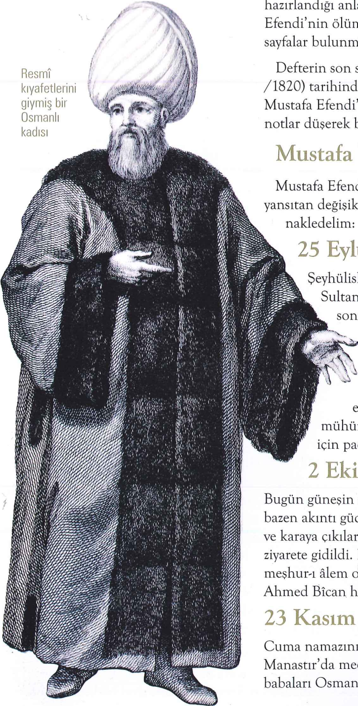
Resmî kıyafetlerini giymiş bir Osmanlı kadısı