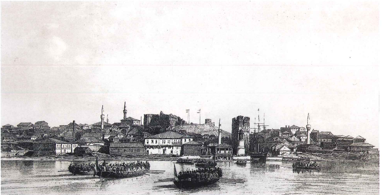
Gelibolu sahilini gösteren eski bir gravür (Jean Baptiste Henri / Eugène Cicéri)

Kağıthane tamamlandığından sadrazam hazretleri padişah-ı âlem-penâh hazretlerini art arda üç gün davet edip at koşuları, top ve tüfenk atma ve diğer eğlenceli şeylerle eğlendirmişlerdir. Anadolu ve Rumeli kazaskerleriyle Şeyhülislâm da davet olunmuştur. Kağıthane'nin ismi de değiştirilerek Sadâbâd diye adlandırılmıştır. Hatta bu sıralarda düşürülen tarihlerde de bu isimle